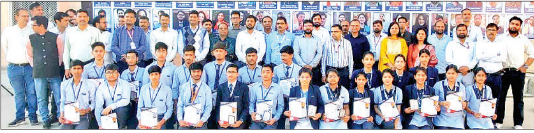
महेन्द्रगढ़। सफल विद्यार्थियों को सम्मानित करते हुए।