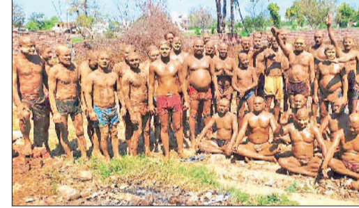
महेन्द्रगढ़। मिट्टी का लेप लगाकर होली खेलते हुए।