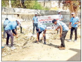
नारनौल। साफ-सफाई करते स्वयंसेवक।