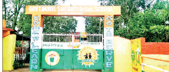
महेंद्रगढ़। राजकीय मॉडल संस्कृति विद्यालय का मुख्यालय।

सरकार ने सीबीएसई बोर्ड से संबद्ध राजकीय मॉडल संस्कृति स्कूलों में नए शिक्षा सत्र 2024-25 के लिए दाखिले का शेड्यूल जारी कर दिया है। दाखिला शेड्यूल के अनुसार राजकीय मॉडल संस्कृति प्राइमरी स्कूल व राजकीय मॉडल संस्कृति विरिष्ठ माध्यमिक स्कूल में कक्षा पहली से पांचवी, छठी से आठवीं, नौवीं से 12वीं कक्षा में दाखिला के लिए एक अप्रैल से दाखिला प्रक्रिया शुरू की जाएगी। जबकि 26 अप्रैल को दाखिले की सूची जारी की जाएगी। इस दाखिला प्रक्रिया के तहत इन कक्षाओं में दाखिला लेने