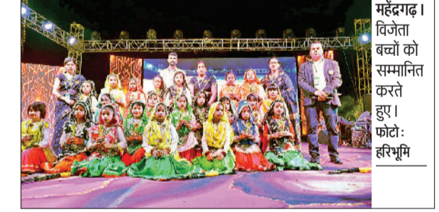
महेन्द्रगढ़। विजेता बच्चों को सम्मानित करते हुए।