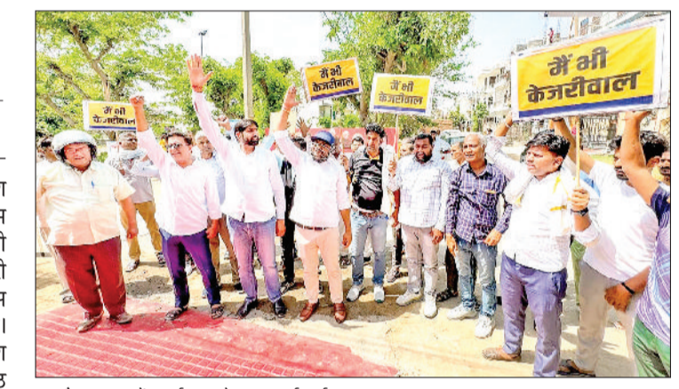
नारनौल। शहर में प्रदर्शन करते आप कार्यकर्ता।