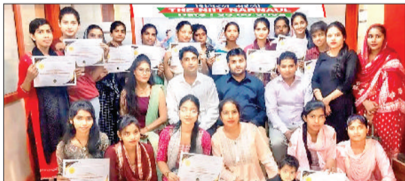
नारनौल। सेमिनार में सम्मानित होने वाली महिलाएं।

धरुहड़ा। क्षेत्र के एक गांव में पति के साथ किराए के मकान में रह रही महिला पति के कंपनी में ड्यूटी जाने के बाद तीन साल की बेटी के साथ लापता हो गईं। पति ने बताया कि वह एक कंपनी में था। 24 मार्च की शाम को जब घर लौटा, तो उसकी पत्नी और बेटी घर पर नहीं मिली।